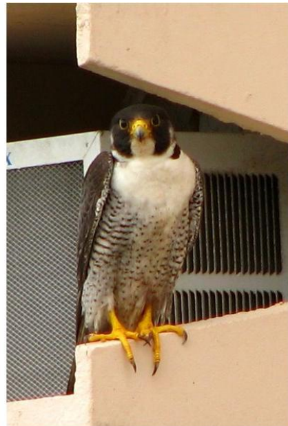
Indivíduo adulto em seu poleiro de repouso. Outubro de 2009.

Em ambientes urbanos, o F. peregrinus costuma pousar em poleiros altos, como torres de celulares, prédios altos com colunas de caixas de ar condicionado, catedrais com torres altas, quinas e bordas de terraços de prédios altos. Usa estes locais como poleiro de repouso e de caça. Normalmente