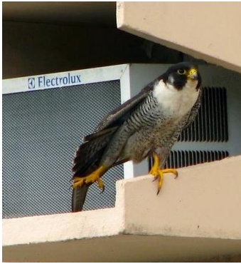
Indivíduo adulto em seu poleiro de repouso. Outubro de 2009.

Cuculidae, Tyrannidae, Columbidae, Rallidae, Emberizidae, morcegos e insetos.