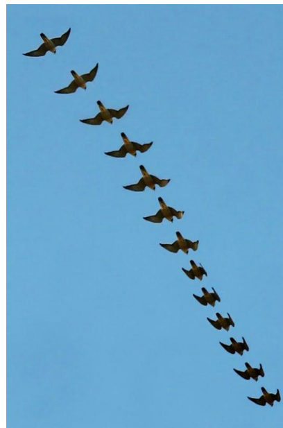
Mergulho de um indivíduo obtido a partir dos frames de um vídeo.

Nas áreas urbanas, o F. peregrinus , mesmo após escurecer, ainda pode continuar caçando, predando insetos voadores (mariposas e libélulas) e morcegos,