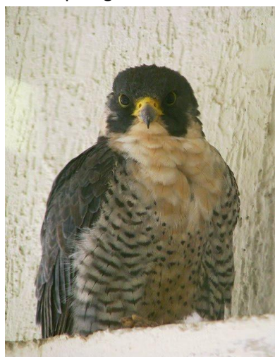
Indivíduo fêmea. Salvador/BA, Dezembro de 2008.

O falcão-peregrino ( Falco peregrinus , Tunstall 1771), cosmopolita, é uma ave de rapina de porte médio, muito conhecida pela velocidade, comportamento de caça e instintos migratórios. Os falcões-peregrinos da América do Norte migram para