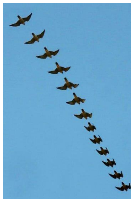
Mergulho de um indivíduo obtido a partir dos frames de um vídeo.

Um indivíduo acompanhado em Salvador era altamente especializado em predação pombo-doméstico ( Columba livia ). Todo o padrão de atividade e adoção de pontos e estratégias de caça, rotatividade de