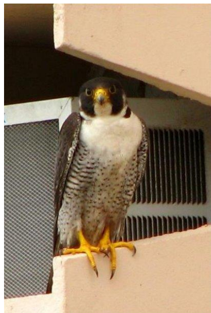
Indivíduo adulto em seu poleiro de repouso. Outubro de 2009.

Pode ser encontrado em todo o Brasil, contando com poucos registros no estado de Mato Grosso e Goiás. Há uma grande presença da espécie nos centros urbanos, principalmente nas cidades costeiras, de norte a sul do país. Mas há uma maior ocorrência deles ao que parece, na região Nordeste, especialmente nos limites de Pernambuco. Em trechos da região sudeste e sul também há grande número de falcões peregrinos usando áreas regulares de invernagem, principalmente em área urbana próxima à costa, mas no interior também e até em áreas de campos abertos e regiões serranas e sem urbanização. Geralmente eles têm preferência em usar áreas costeiras de grandes centros urbanizados, com grandes construções possibilitando poleiros altos propiciando grande visibilidade. Cidades como Recife, Rio de Janeiro, Salvador, dentre outras, possuem um grande número de edifícios, que são recursos estratégicos de pouso e caça para essas aves. Nestas cidades também apresentam um alto número de presas potenciais, como pombos e aves marinhas (andorinhas do mar, principalmente), viabilizando a permanência dos falcões nestas cidades.