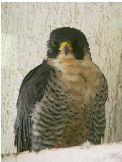
Fêmea adulta. Salvador/BA, dez 2008.