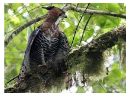
Gavião-de-penacho ( Spizaetus ornatus )

Após conversar com alguns colegas e ler opiniões de outros ornitólogos, e considerando também a grande diversidade de variações da espécie, concluo que se trata de uma variação extrema de plumagem do Leptodon cayanensis jovem. As proporções do bico e das patas, olhos escuros, narinas em forma de fendas, tarsos nus, tamanho da asa em relação a cauda, etc. são todas características do L. cayanensis , exceto, é claro, o penacho.