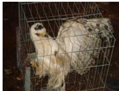
Jovem gavião-de-cabeça-cinza ( Leptodon cayanensis )