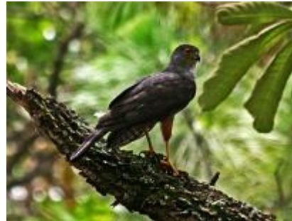
Gavião-bombachinha-grande ( Accipiter bicolor )