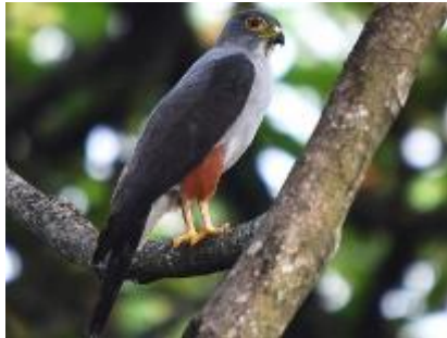
Gavião-bombachinha ( Harpagus diodon )