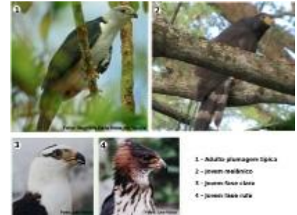
Algumas plumagens conhecidas do gavião-de-cabeça-cinza ( Leptodon cayanensis )