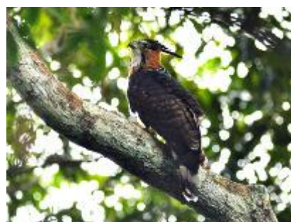
Jovem gavião-de-cabeça-cinza ( Leptodon cayanensis )