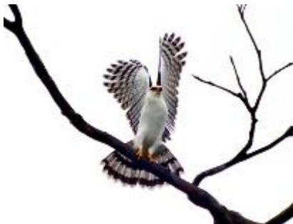
Jovem gavião-de-cabeça-cinza ( Leptodon cayanensis )