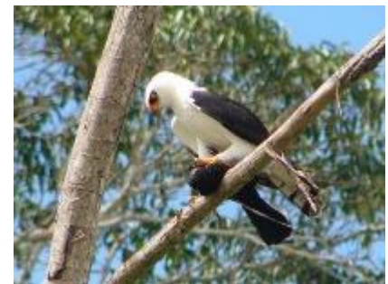
Gavião-pato ( Spizaetus melanoleucus)