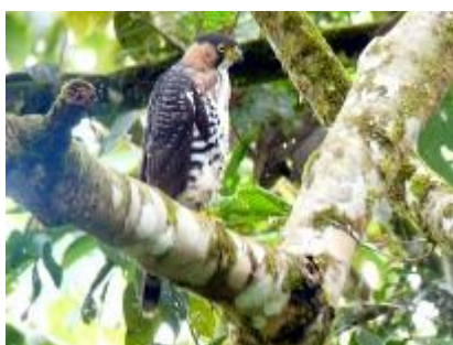
Jovem tauató-pintado ( Accipiter poliogaster )

A descoberta da ave gerou uma série de discussões, seria o gavião uma nova espécie? Subespécie? Um indivíduo híbrido? Ou apenas uma variação extrema de plumagem? Será que o penacho permanece na forma adulta? Seria o penacho uma característica vestigial manifestada somente nos jovens? Infelizmente, muitas dessas questões vão ficar sem respostas.