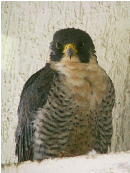
Fêmea adulta. Salvador/BA, dez 2008.