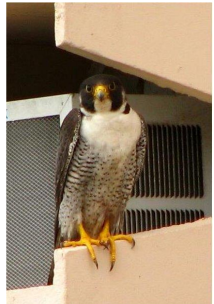
Indivíduo adulto em seu poleiro de repouso. Outubro de 2009.

Pode ser encontrado em todo o Brasil, contando com poucos registros no estado de Mato Grosso e Goiás. Há uma grande presença da espécie nos centros urbanos, principalmente nas cidades costeiras, de norte a sul do país. Mas há uma maior ocorrência deles ao que parece, na região Nordeste, especialmente nos limites de Pernambuco. Em trechos da região sudeste e sul também há grande número de falcões peregrinos usando áreas regulares de invernagem, principalmente em área urbana próxima à costa, mas no interior também e até em áreas de campos abertos e regiões serranas e sem urbanização. Geralmente eles têm preferência em usar áreas costeiras de grandes centros urbanizados, com grandes construções possibilitando poleiros altos propiciando grande visibilidade. Cidades como Recife, Rio de Janeiro, Salvador, dentre outras, possuem um grande número de edifícios, que são recursos estratégicos de pouso e caça para essas aves. Nestas cidades também apresentam um alto número de presas potenciais, como pombos e aves marinhas (andorinhas do mar, principalmente), viabilizando a permanência dos falcões nestas cidades.