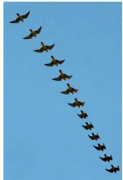
Mergulho de um indivíduo obtido a partir dos frames de um vídeo.

Um indivíduo acompanhado em Salvador era altamente especializado em predação pombo-doméstico ( Columba livia ). Todo o padrão de atividade e adoção de pontos e estratégias de caça, rotatividade de