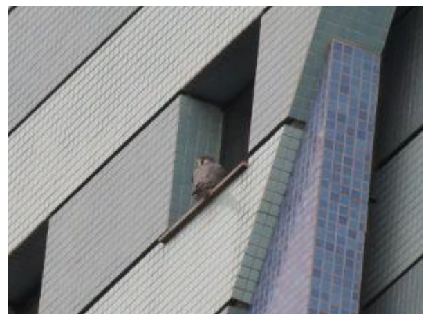
Indivíduo pousado na janela do último andar de um edifício. Maringá/PR. Janeiro de 2014.