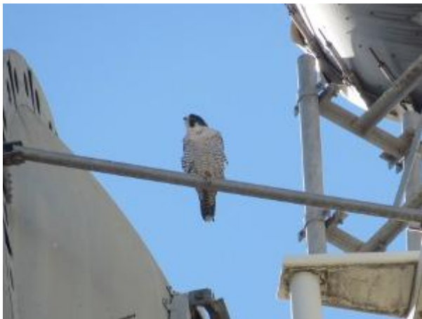
Indivíduo no alto de uma torre de telefonia. Maringá/PR. Janeiro de 2014.

Nas áreas rurais os peregrinos também podem ser observados, principalmente aquelas regiões com grande concentração de pombos-de-bando. Nesses ambientes eles costumam usar árvores altas como Eucaliptos e Araucárias como poleiros de caça e descanso. Estas árvores possuem uma configuração ideal para o falcão-peregrino: são altas, esguias e pouco frondosas, ideais para servir de poleiro e permitindo que o falcão tenha uma melhor visibilidade não muito interceptada por folhagem densa, como acontece em outras árvores (Drummond, 2010). No noroeste do Paraná, na área rural dos municípios de Peabiru e Londrina, já realizei uma série de observações de falcões-peregrinos usando araucárias ( Araucaria angustifolia ) ilhadas pela paisagem agrícola, como poleiro de caça. Normalmente os lugares onde o falcão-peregrino era avistado continham centenas talvez milhares de pombas-de-bando ( Zenaida auriculata ).