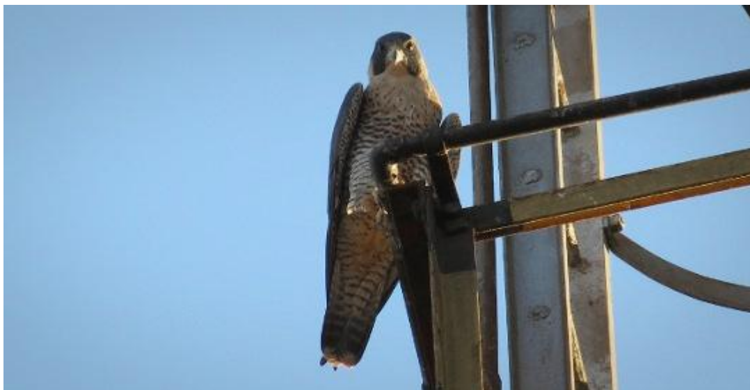
Falcão-peregrino ( F. peregrinus ), fêmea adulta. Maringá/PR.