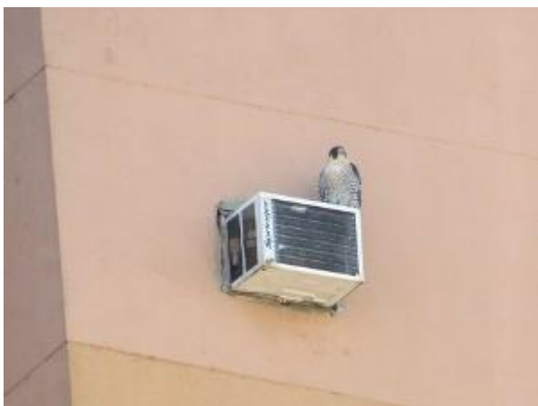
Indivíduo descansando em uma caixa de ar- condicionado. Maringá/PR. Janeiro de 2014.