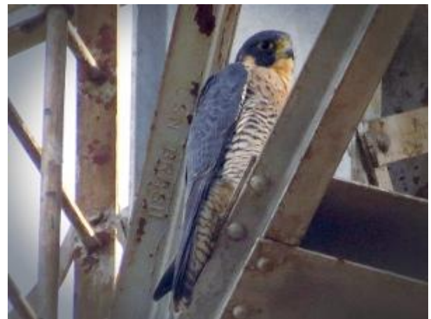
Indivíduo descansando no alto de uma torre. Maringá/PR. Fevereiro de 2014.