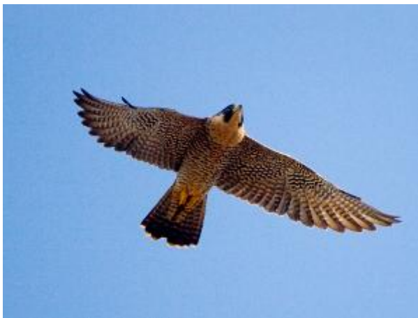
Indivíduo fêmea em voo no centro de Maringá/PR. Janeiro de 2014.

Com edifícios altos que oferecem poleiros de caça e descanso e grande presença de pombos que garantem um amplo suprimento alimentar, não é de se surpreender que os falcões-peregrinos prefiram as cidades do que o campo. Além disso, a iluminação artificial das cidades tem proporcionado novas oportunidades de caça para o falcão, como bacuraus, corujas e outras aves noturnas. A evidência do comportamento de caça noturna ilustra o quão bem adaptados estão os falcões ao ambiente urbano.